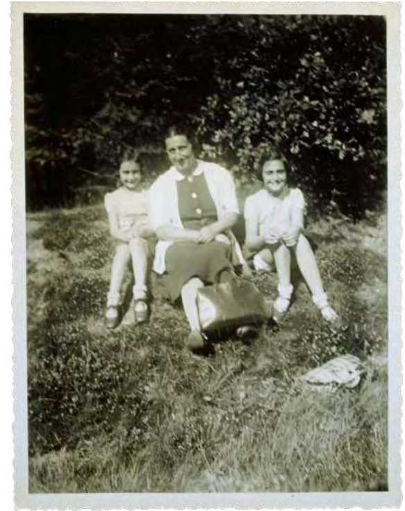
Edith Frank avec ses filles Margot et Anne à Sils Maria, été 1937. Aucune n'a survécu à l'Holocauste.